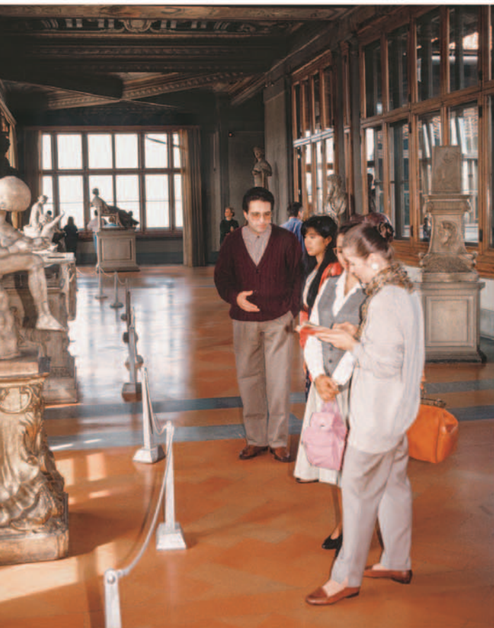
Galleria degli Uffizi, Firenze

трудолюбие и приобретенные навыки, особенно умение приспособливаться к новым условиям. Поэтому хорошо, когда мальчики и девочки, вырастая, становятся такими людьми, у которых, по словам Монтеня, эссеиста эпохи Возрождения, «не много знающая, а хорошо думающая голова».